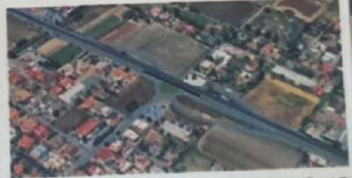
Fotoinserimento di progetto