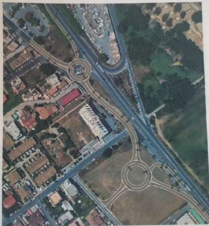
Planimetria dello stato di progetto

Importo lavori (Prezzario ANAS 2024) 1.500.000,00 M/EUR