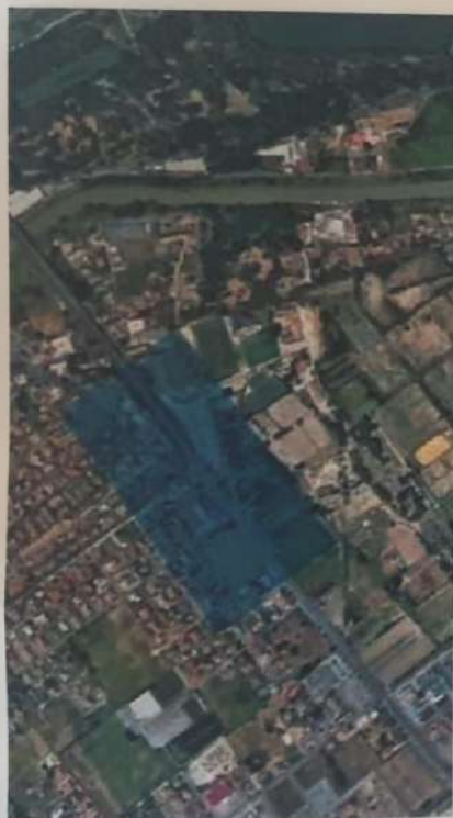
Planimetria dello stato di fatto