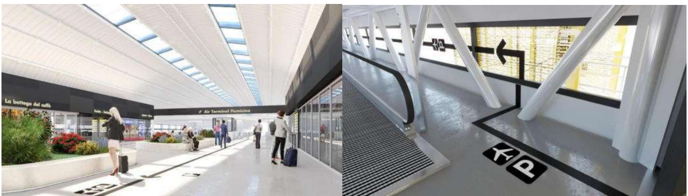
viste atrio di stazione e fingers

Tale configurazione progettuale è impostata in modo da costituire un upgrading della stazione in previsione del Giubileo, è in corso la progettazione che terminerà nel corrente anno.