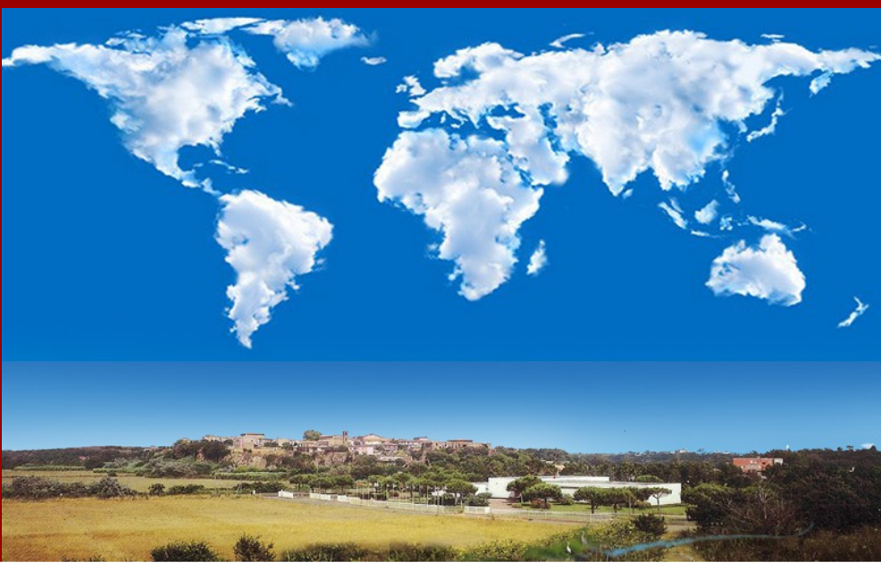
Il MUSEO MANZU' si trova sotto la rupe di ARDEA: Giacomo Manzù (1908-1991) è sepolto, secondo la sua ultima volontà, nel parco del suo museo

La finalità del COMITATO POPOLARE "PACE per MANZU'" è quella di 30.000 visitatori, in un anno, al MUSEO MANZU' a partire dal prossimo mese di agosto con un programma di iniziative in attuazione di quello che prevede la legge nell'interesse generale.